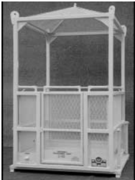
MODELO S-100 48" X 48" X 88"

Se muestra con techo de metal expandido opcional y ensamble de peso de prueba.