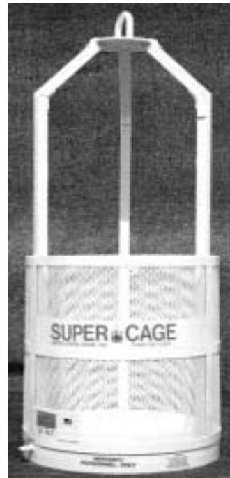
MODELO S-R7 36" D.E. X 88"

Se muestra con techo de metal expandido opcional y ensamble de peso de prueba.